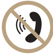
피트니스 내 전화통화 자제