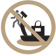
기구 선점 금지