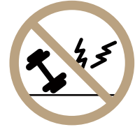
매너있는 기구 사용