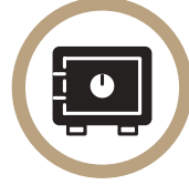
귀중품은 리셉션에 보관