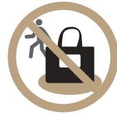
공용공간(탕 내, 파우더룸)에서의 자리 선점 금지