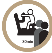
웨이팅 시 기구 사용은 30분 권장