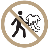
클럽 물품 외부 반출 금지 (운동복, 양말 등)